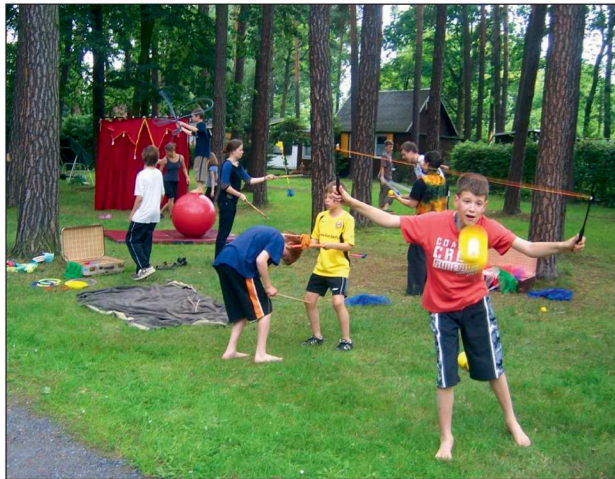
Probier mal was Neues aus! Vielfältige sportliche Möglichkeiten im Sportcamp.

Du denkst, Sommerferien sind nicht nur zum Faulenzen gedacht? Du hast Lust, dich zu bewegen und neue Sportmöglichkeiten kennen zu lernen? Dann ab ins Waldbad Weixdorf! Ob unter, im oder auf dem Wasser, im Erdinneren, in luftiger Höhe auf dem Felsen oder einfach mal auf dem ebenen Boden – Hauptsache in Aktion!