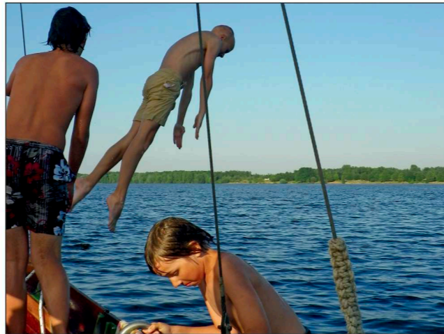
Action auf und im Wasser

„Ruder hart Backbord und die Segel dicht!“ So könnte es für die Teilnehmer des nunmehr 3. Segelcamps heißen. Diesmal wollen wir uns an und auf die Ostsee wagen. In Neuhoof bei Stralsund werden wir unser Quartier aufschlagen.