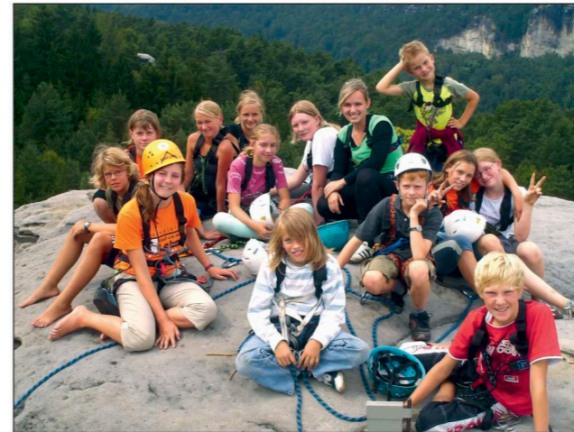
Luftige Herausforderungen für Kletterfreunde und solche, die es werden wollen

Wer hoch hinaus will, muss nicht unbedingt die ganze Welt bereisen. Ein felsiges Abenteuer für Uner-schrockene bietet dir die Sächsische Schweiz allemal – und das nicht nur mit allen Vieren beim Klettern oder Boofen. Auch auf deinen zwei Füßen kannst du im Elbsandsteingebirge so einiges erleben und entdecken.